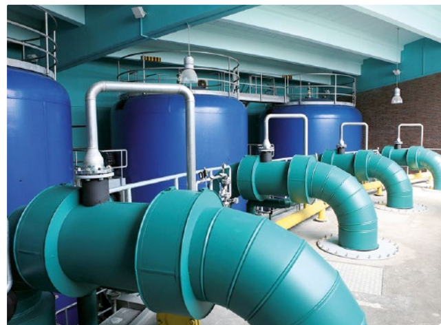
Trinkwasserfilter im Wasserwerk Am Staad.

Eine repräsentative Umfrage zeigt: Rund zwei Drittel der Deutschen nutzen Leitungswasser täglich als Getränk.